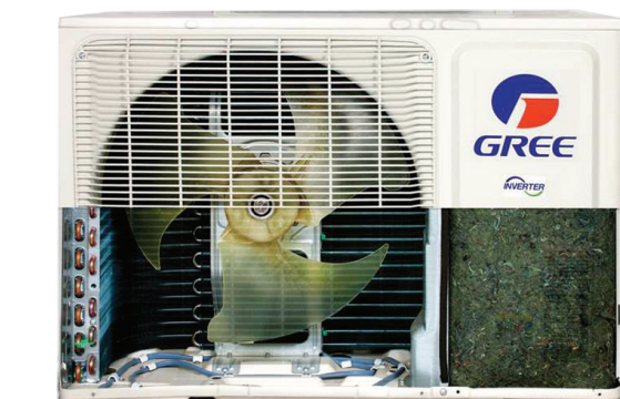
Base avec élément chauffant

Les unités extérieures de la Lomo sont équipées d'une base chauffante qui empêche le condensat de geler, assurant ainsi une pleine efficacité du chauffage.